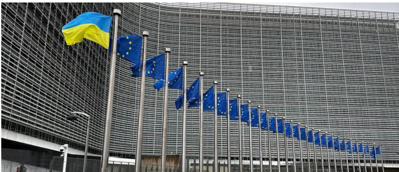
9 травня 2023: Україна вперше відзначає День Європи. У зв'язку з цим біля будівлі Європейської Комісії поруч зі стягами ЄС підняли український прапор